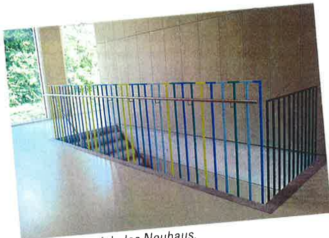
Eingangsbereich des Neubaus.