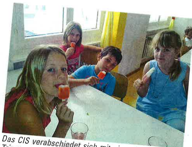
Das CIS verabschiedet sich mit einer Glacé von den Tagesschulkindern.