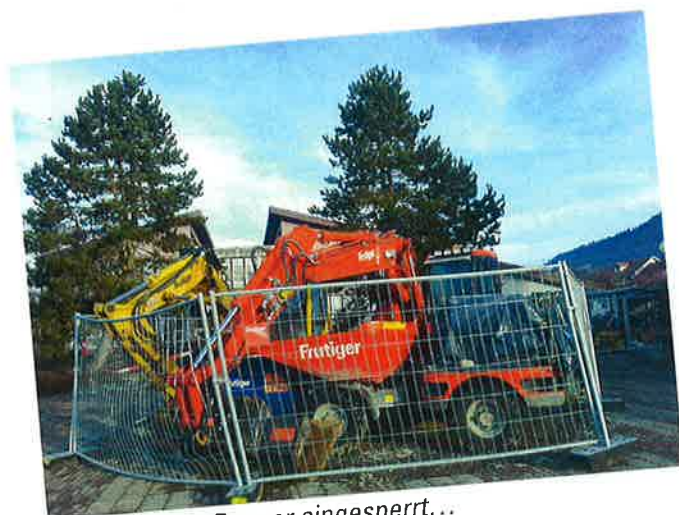
Noch sind die Bagger eingesperrt...